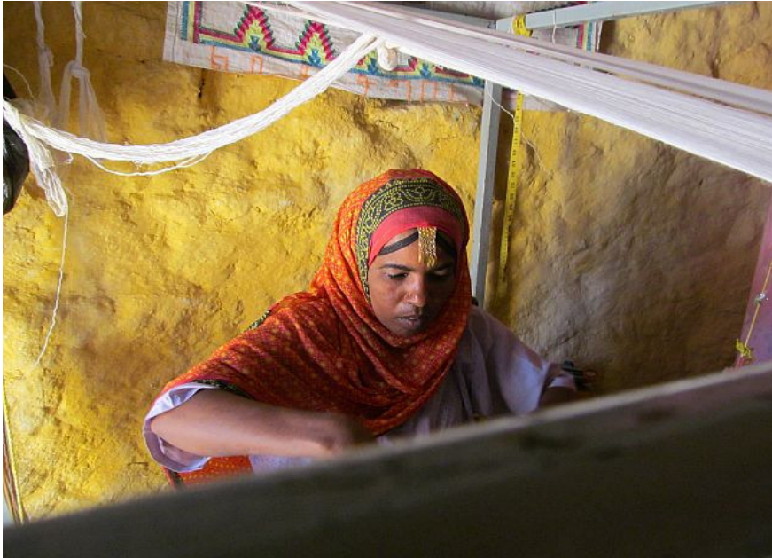
Geconcentreerd aan het werk